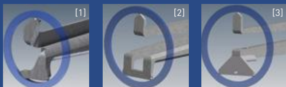
Kugel 0,6mm Ball 0,6 mm